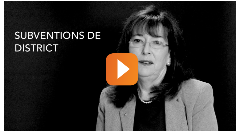
L'avis des Rotariens

Les demandes des clubs sont étudiées par la commission Subvention de district composée du gouverneur (ou du gouverneur élu s'il s'agit de la subvention de son année de mandat) et des responsables Fondation/Subventions de district. La commission doit prendre en compte certains paramètres tels que la qualité du projet et l'historique de don du club à la