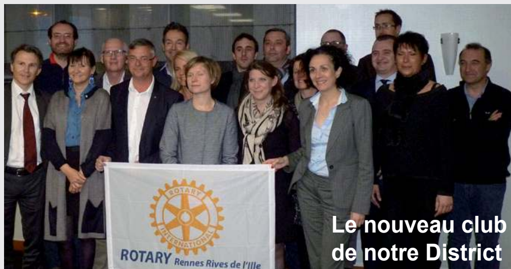
Le nouveau club de notre District