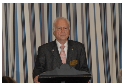
L'intervention du Président du CIP France-USA