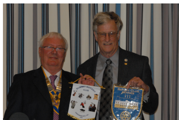
La remise traditionnelle des fanions