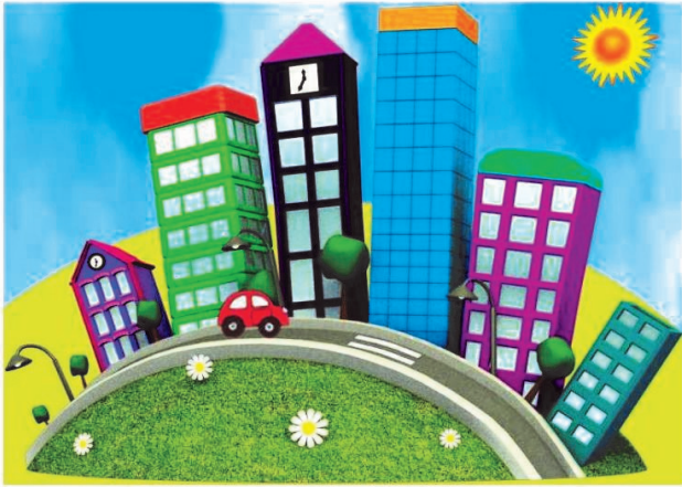
« LES PETITS BUREAUX »