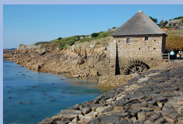
BREHAT-LE MOULIN A MAREE