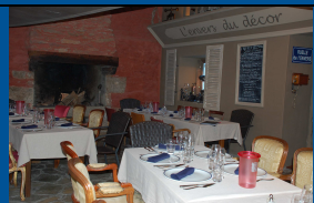
Voici " L'ENVERS DU DECOR "