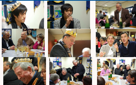
Chaleureuse ambiance !